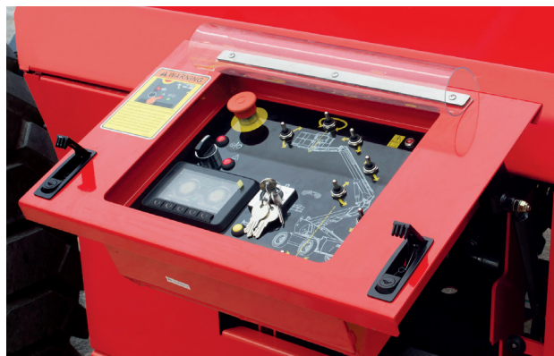
Pannello comandi da terra ergonomico