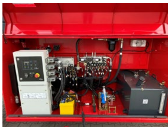
Sistema diagnostico a bordo