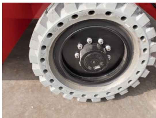
Pneumatici airride rt