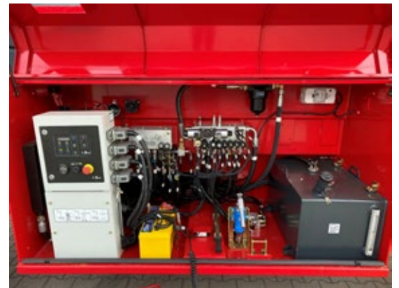
Sistema de diagnóstico a bordo